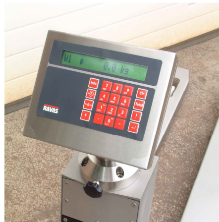
Indicateur rotatif avec clavier alphanumérique et affichage